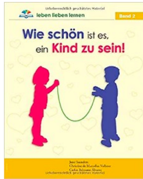
Band 2: Wie schön ist es, ein Kind zu sein! Alter 7-8 Jahre

In Band 2 entdecken Laura, Tim und ihre Freunde, wie Menschen miteinander umgehen und wie sie zusammenleben. Wie sich das Leben in der Familie ändert und weiterentwickelt und dass auch ein winzig kleiner Mensch schon eine Person ist, erfährt Laura ganz besonders, als ihre kleine Schwester Teresa auf die Welt kommt.