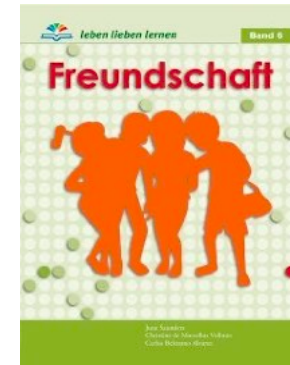
Band 6: Freundschaft, Alter 11-12 Jahre

Wie schließen wir Freundschaften, bewahren sie und woran kann sie scheitern? Was kann man dann tun? Das erfahren Tim und Laura in der Familie, in der Schule, in der Nachbarschaft. Auch über den engen Umkreis hinaus, zwischen fremden Ländern, Völkern und Nationen entstehen Verbindungen und bleibende Freundschaften. All das lernt man in diesem Band.