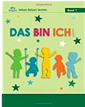
Band 1: Das bin ich. Alter 6-7 Jahre

Die Geschichten der Reihe „leben lieben lernen“ beruhen auf wissenschaftlichen Recherchen und Erfahrungen eines Teams internationaler Fachleute (Lehrer, Psychologen und Sozialwissenschaftler) und wurden in Zusammenarbeit mit Eltern, Kindern und Jugendlichen der jeweiligen Altersstufen entwickelt. Sie werden bereits in vier Kontinenten und in über 13 Ländern in den Schulen benutzt! Unsere digitalen Ausgaben können Sie ideal zum Unterricht im Learning Management System (LMS) BlinkLearning einsetzen.