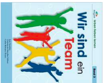
Band 3: Wir sind ein Team, Alter 8-9 Jahre

Laura und Tim sind überrascht, als ihr Lehrer ihnen sagt, dass Sport genauso wichtig ist wie alle anderen Fächer. Sport und Spiel haben in jeder Gesellschaft ihren festen Platz und ihren Sinn. Sie lernen, dass Durchhaltevermögen, Respekt, Aufrichtigkeit und Fairness nicht nur im Sport eine große Rolle spielen, sondern auch im Alltagsleben, zu Hause und in der Schule.