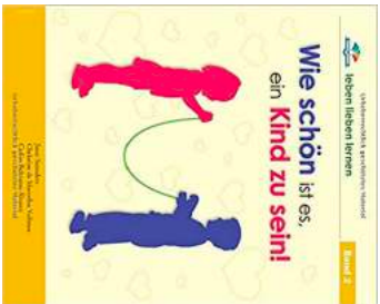
Band 2: Wie schön ist es, ein Kind zu sein! Alter 7-8 Jahre

In Band 2 entdecken Laura, Tim und ihre Freunde, wie Menschen miteinander umgehen und wie sie zusammenleben. Wie sich das Leben in der Familie ändert und weiterentwickelt und dass auch ein winzig kleiner Mensch schon eine Person ist, erfährt Laura ganz besonders, als ihre kleine Schwester Teresa auf die Welt kommt.