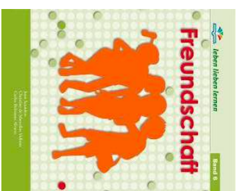
Band 6: Freundschaft, Alter 11-12 Jahre

Wie schließen wir Freundschaften, bewahren sie und woran kann sie scheitern? Was kann man dann tun? Das erfahren Tim und Laura in der Familie, in der Schule, in der Nachbarschaft. Auch über den engen Umkreis hinaus, zwischen fremden Ländern, Völkern und Nationen entstehen Verbindungen und bleibende Freundschaften. All das lernt man in diesem Band.