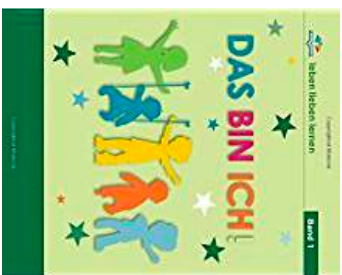
Band 1: Das bin ich. Alter 6-7 Jahre

Die Buchserie umfasst dreizehn Bände für Kinder im Alter von 5 bis 18 Jahren. Sie ist geeignet für Zuhause, für den Einsatz in der Schule und für vielfältige Gruppenarbeit. Die Bücher vermitteln anhand von Themen aus dem Alltag universelle menschliche Werte, die Kindern helfen, eine starke und reife Persönlichkeit zu entwickeln. Die Geschichten der Reihe „Leben lieben lernen“ beruhen auf wissenschaftlichen Recherchen und Erfahrungen eines Teams internationaler Fachleute (Lehrer, Psychologen und Sozialwissenschaftler) und wurden in Zusammenarbeit mit Eltern, Kindern und Jugendlichen der jeweiligen Altersstufen entwickelt. Sie werden bereits in vier Kontinenten und in über 13 Ländern in den Schulen benutzt! Unsere digitalen Ausgaben können Sie ideal zum Unterricht im Learning Management System (LMS) BlinkLearning einsetzen.