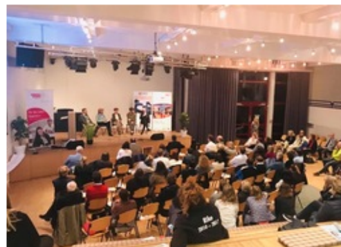
Aula der FCGS

Dies war Inhalt unseres 12. Themenabends, zu dem wir im Oktober zusammen mit kooperierenden Verbänden in den Düsseldorfer Süden eingeladen haben. Es war der erste Abend einer Reihe #Schule,aber_sicher!, die verschiedene Aspekte von Gewalt im schulischen Zusammenhang thematisieren soll.